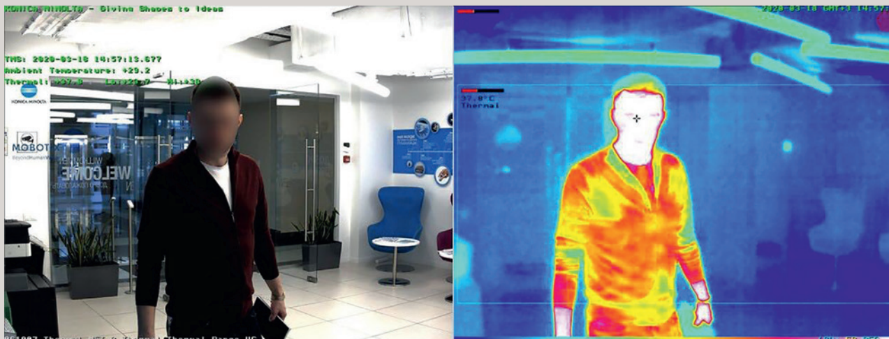
Контроль температуры человека